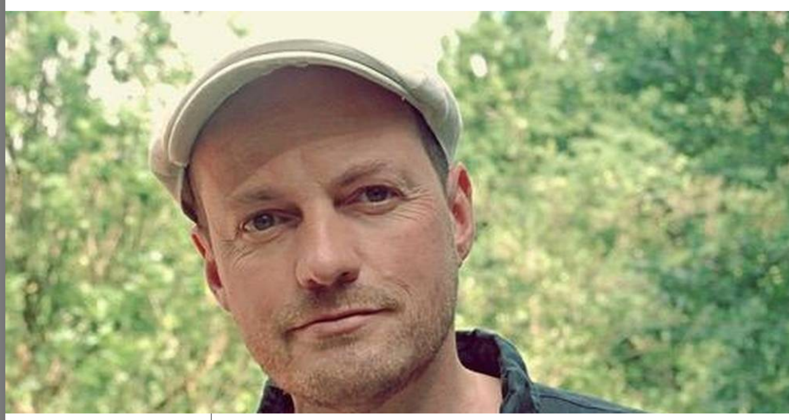
Christian Wustrau